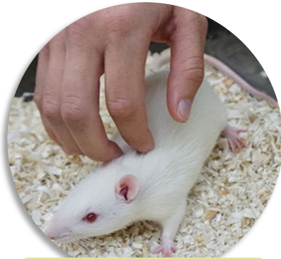
1. Dorsaler Kontakt

Käfig öffnen und Käfigeinrichtung entfernen. Lassen Sie Ihre Hand einige Sekunden im Käfig ruhen, bevor Sie beginnen: