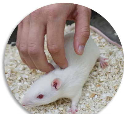
1. Contact dorsal

Placer la cage sur une table. Enlever les objets d'enrichissement de la cage. Placer une main immobile dans la cage pendant quelques secondes avant de procéder avec les manipulations suivantes :