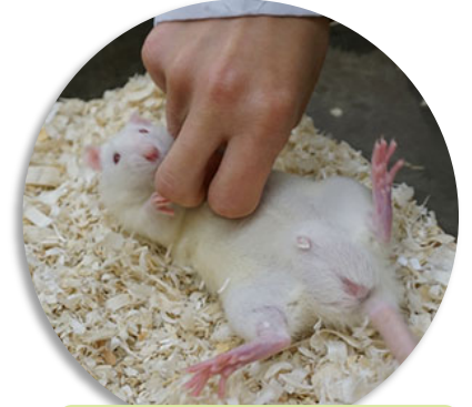
3. Ventraler Kontakt