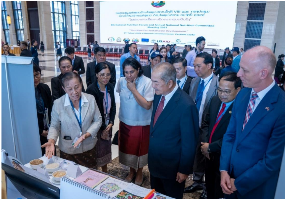
ພະນະທ່ານ ສຈ. ປອ. ກິແກ້ວ ໄຂຄຳພິທູນ ປະທານກອງປະຊຸມຄະນະກຳມະການແຫ່ງຊາດ ຮ່ວມກັບຄູ່ຮ່ວມພັດທະນາ ກຳລັງຢ້ຽມຢາມບຸດວາງສະແດງ ຂອງໂຄງການ ANRCB, ອົງການ CRS